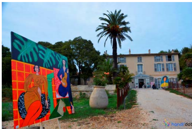
La Villa Brignac, Ollioules (83)

L'Adapei var-méditerranée invite tous les acteurs privés et institutionnels à venir découvrir Handi'dot, ses projets, ses partenaires lors d'une soirée de lancement prévue mardi 14 octobre à 18h00, à la Villa Brignac (Ollioules).